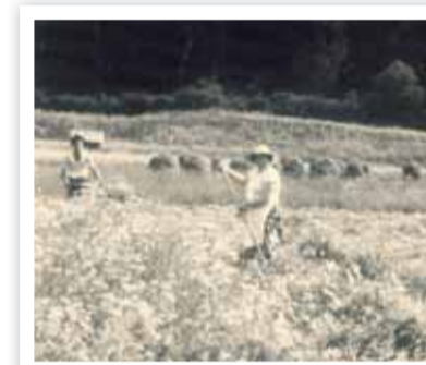
Bei der Heuarbeit