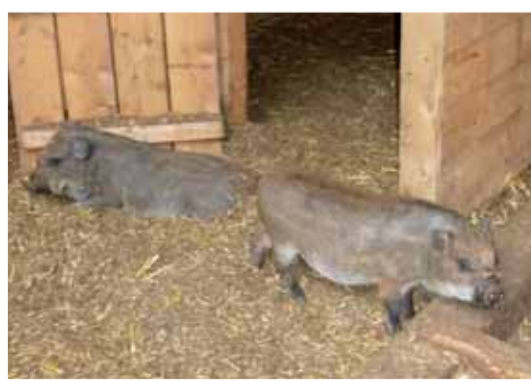
Adam und Eva – die Lieblinge der Kinder