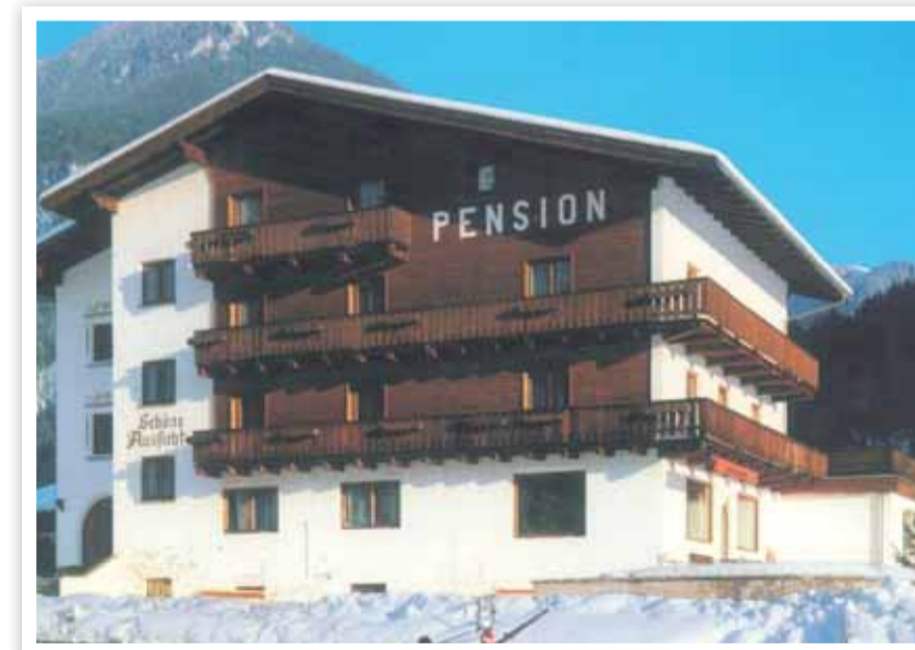
Die Pension in den 70ern