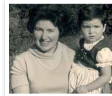
Die zwei flotten Models von der „Schönen Aussicht“