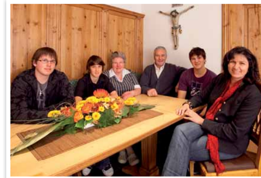
Unsere Familie heute