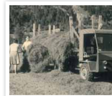
Unser erster Schlepper