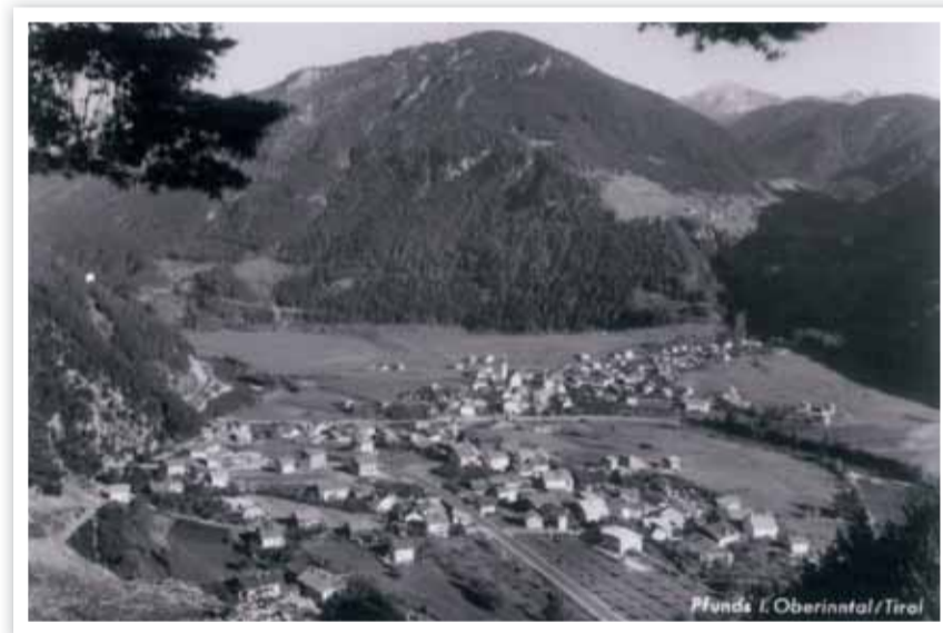
Pfunds um 1960