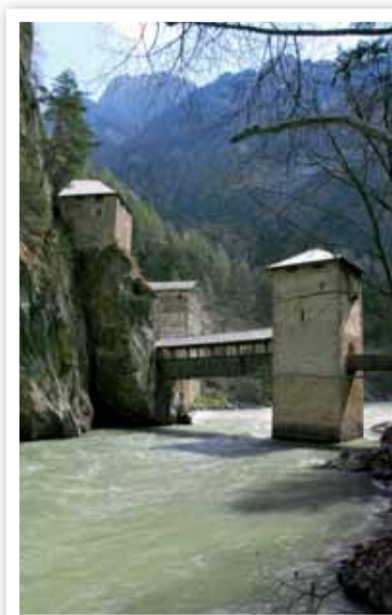
Die Festung Altfinstermünz

1982 erwarben meine Eltern den Schalkhof, ein landwirtschaftliches Anwesen am Weg zur Festung Altfinstermünz. Nachdem mein Vater die Wiesen rund um den Schalkhof gerodet und kultiviert hatte, erfreuen sich unsere Kühe über einen saftigen Sommerweideplatz und werden auf dem Weg nach Altfinstermünz gerne von unseren Gästen besucht. Mit 18 Jahren habe ich den Betrieb meiner Eltern mit damals 40 Betten übernommen, den ich fortan mit Hilfe meiner Mama führte.