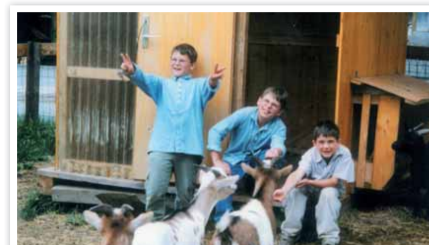
Fütterung der Raubtiere