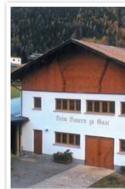
Beim Bauern zu Gast