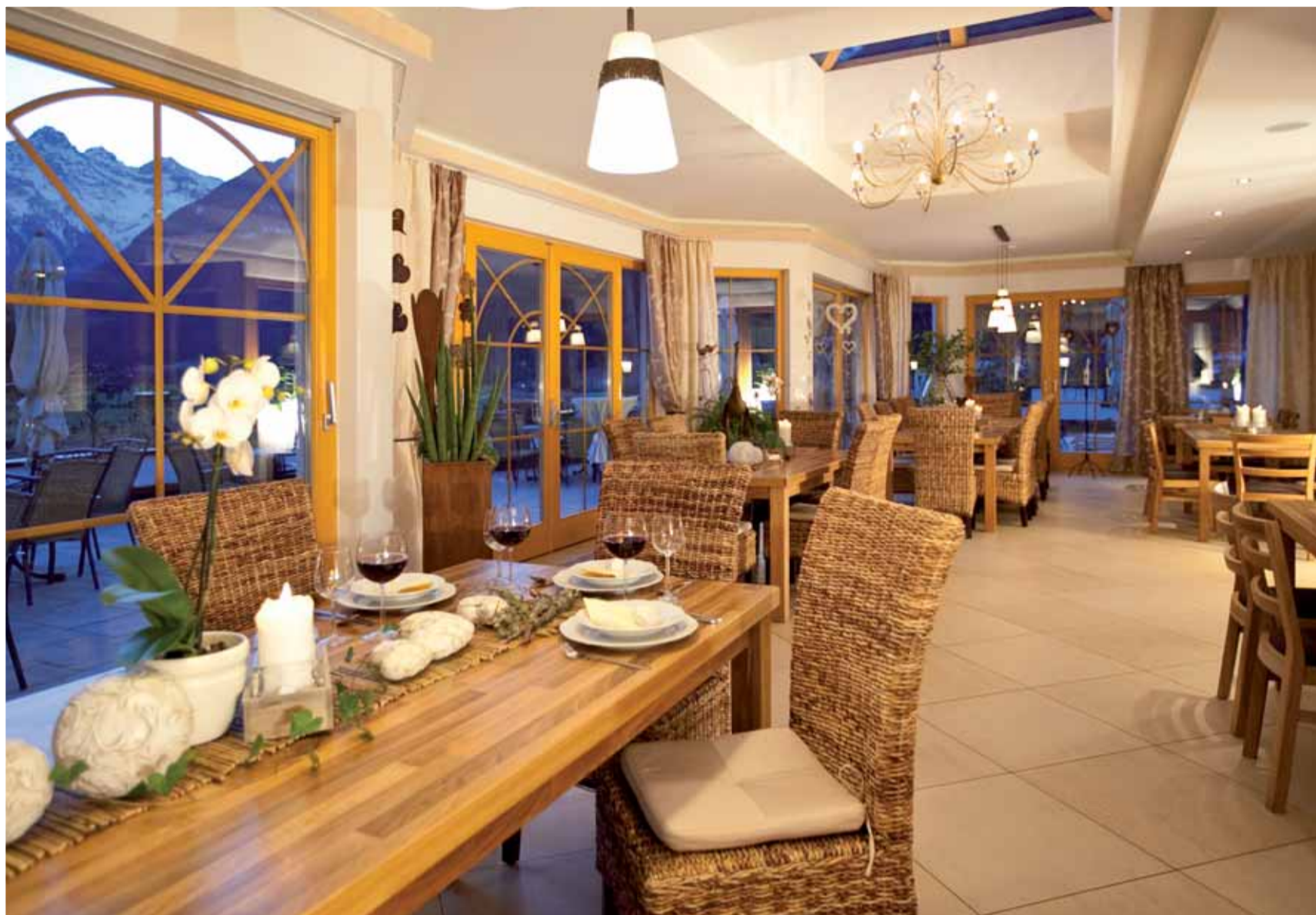
Unser neuer Frühstücksraum