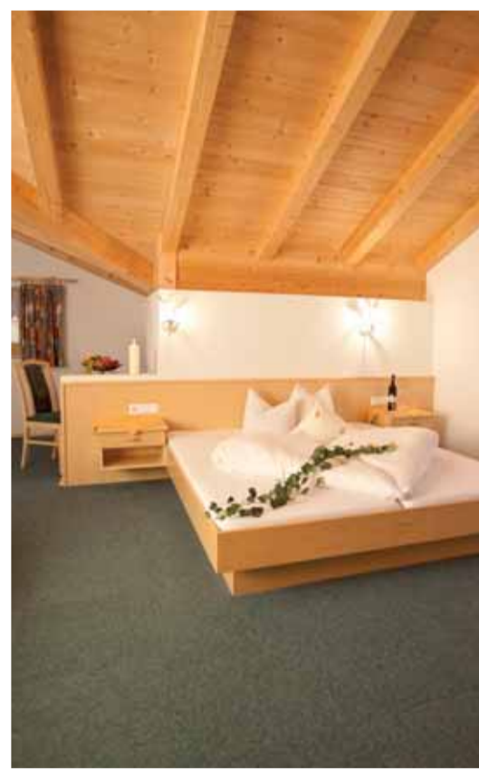
Wohnkomfort für Ihren Urlaub