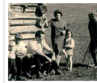
Beim Ausflug in der Tschey