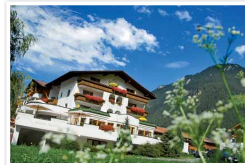
Das Haus heute