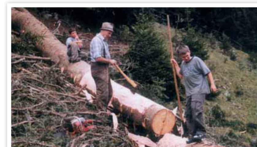
Opa mit den Kindern im Radursch