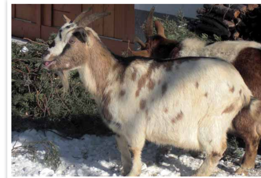
Unsere Mini-Ziegen werden von unseren Gästen sehr verwöhnt