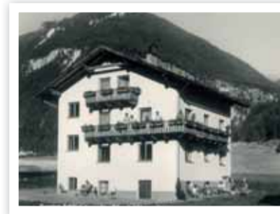
Pension „Schöne Aussicht“

für das Gepäck vom Reisebüro im Dorf ab. Als erste Frau in Pfunds mit Führerschein, dauerte es nicht lange, bis ein „flotter Käfer“ den Handwagen abgelöst hatte.