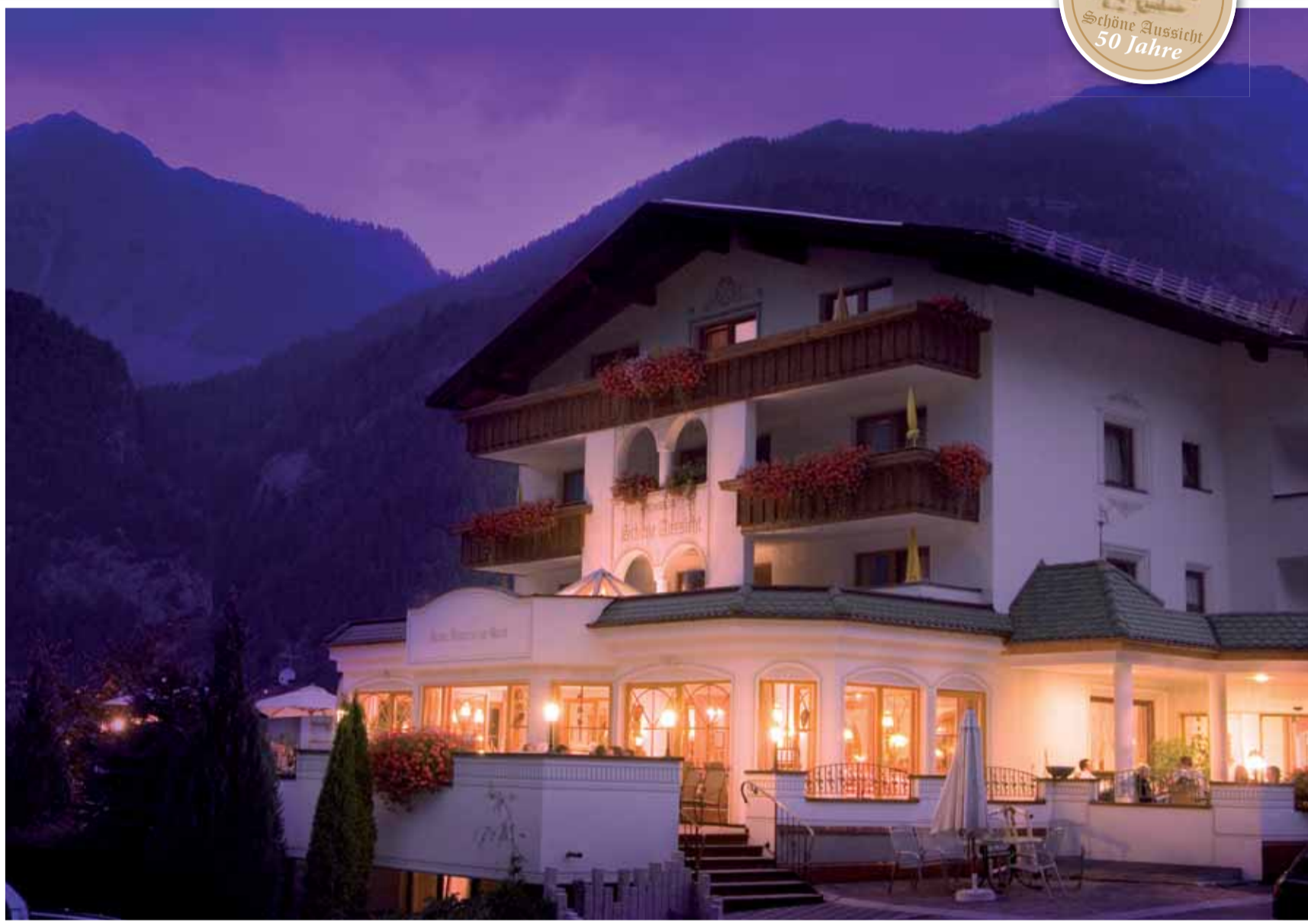
Das Ferienhaus „Schöne Aussicht“ heute