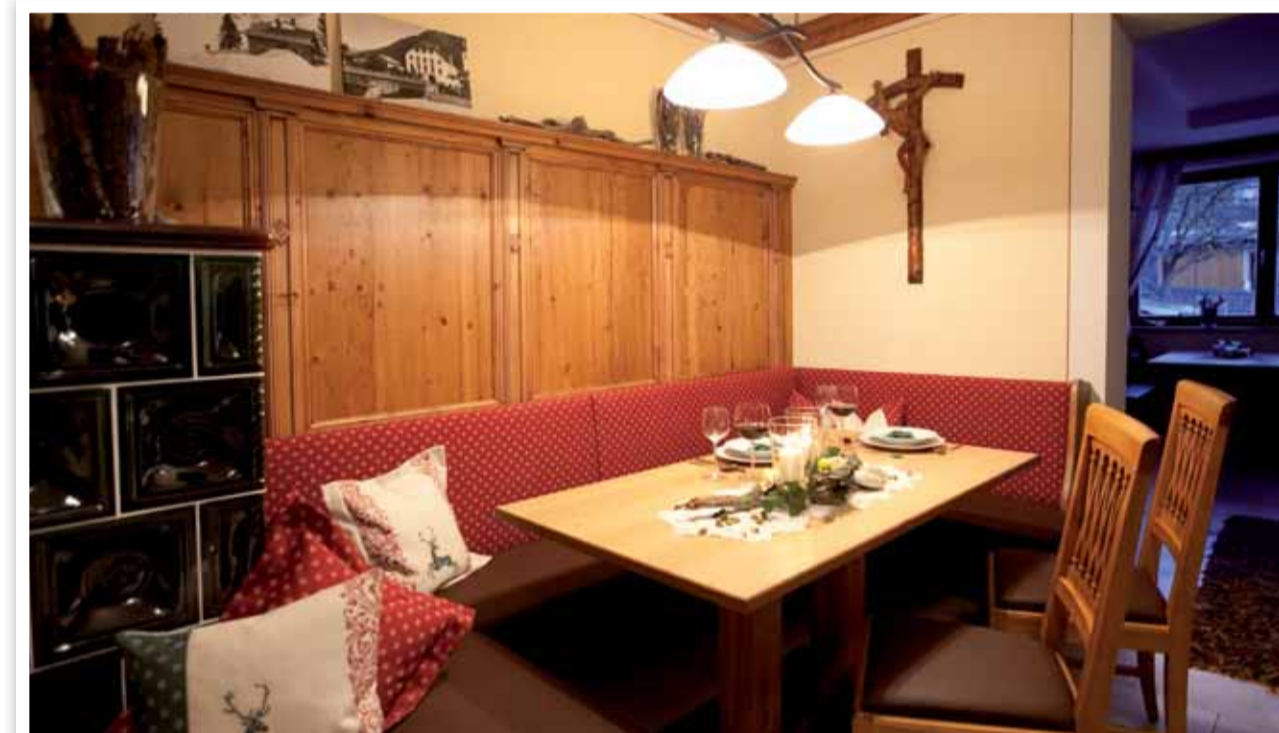
Gemütliche Stimmung am Kachelofen