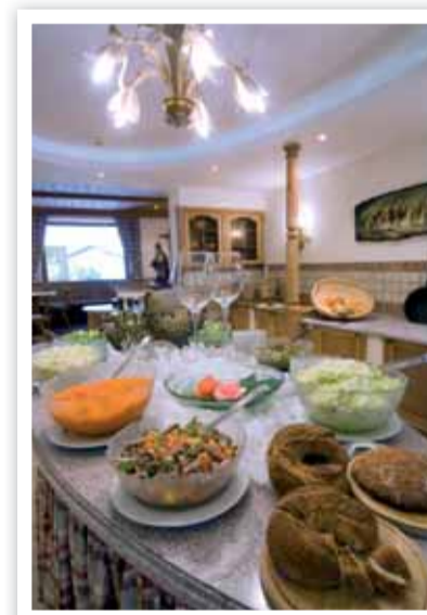
Der neue Buffetraum