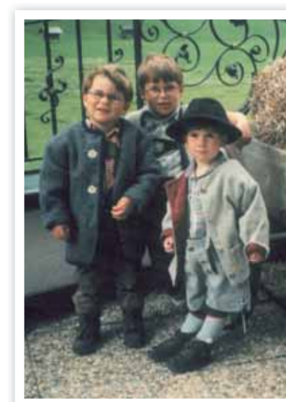
Unsere 3 beim Almabtrieb