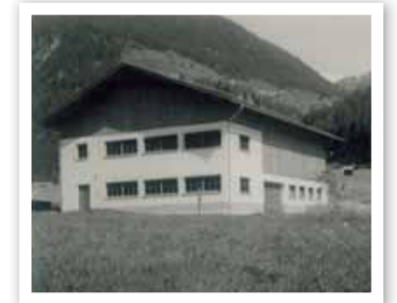
Der neue Stall 1962

Spezialitäten – daneben wurde die Pension ständig erweitert und modernisiert. Dies schätzten unsere Gäste sehr und die Zahl der Stammgäste wurde Jahr um Jahr größer. Gleichzeitig wurde auch in die Landwirtschaft investiert und mein Vater erwarb einige landwirtschaftliche Güter.