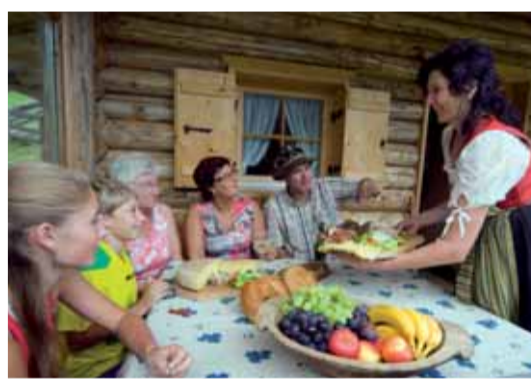
Besuch in unserer Hütte