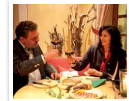
Bei der Brettljause