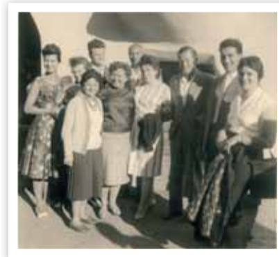
Erste Gäste aus Berlin